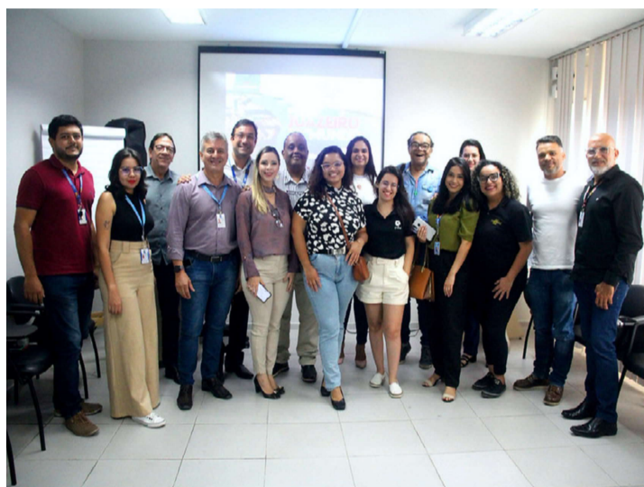
Agradeço ao devino Espírito Santo pela graça alcançada. "H.S.M